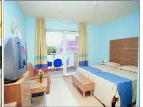
Zimmer - Village „Sol Garden Istra“