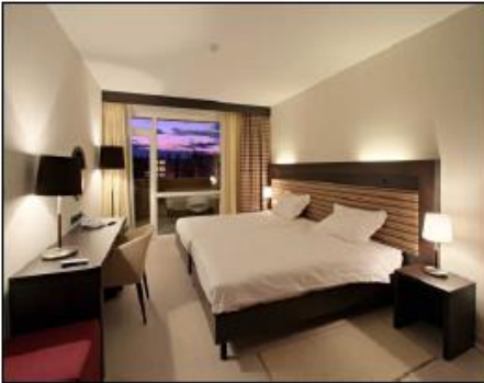
Zimmer - Hotel „Sol Garden Istra“

die 293 klimatisierten Zimmer im Hotel/Village verfügen über Bad od. Dusche, Fön, Balkon, Telefon, Safe, Mini-Bar, ein Internet - Anschluss ( gegen Gebühr ) und Satellitenfernsehen.